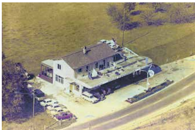
Vue aérienne du garage en 1968