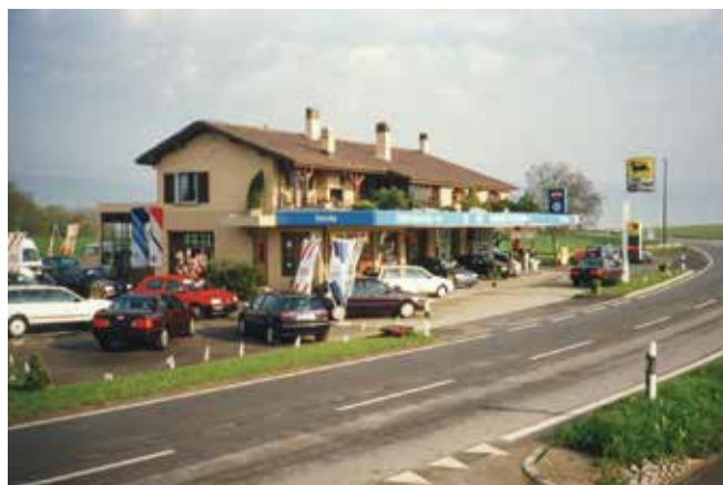
Le garage en 1994