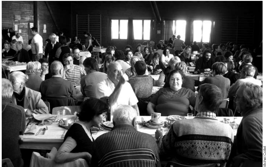
Brunch du 7 février dernier à la grande salle d'Essertines.