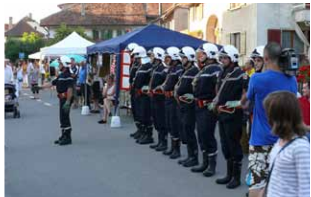
Démonstration par notre corps de Sapeurs-Pompiers avant la restructuration, lors de la fête du village en 2008.

Les membres du DAP possèdent la formation de base leur permettant d'accomplir leurs missions et d'appuyer leurs collègues du DPS sur les interventions importantes. Il existe deux catégories de DAP : - DAP Y, autonomes pour les interventions inondations, sauvetages (sauf avec échelle-automobile) et petites alarmes techniques. - DAP Z, intervenant en renfort du DPS sur