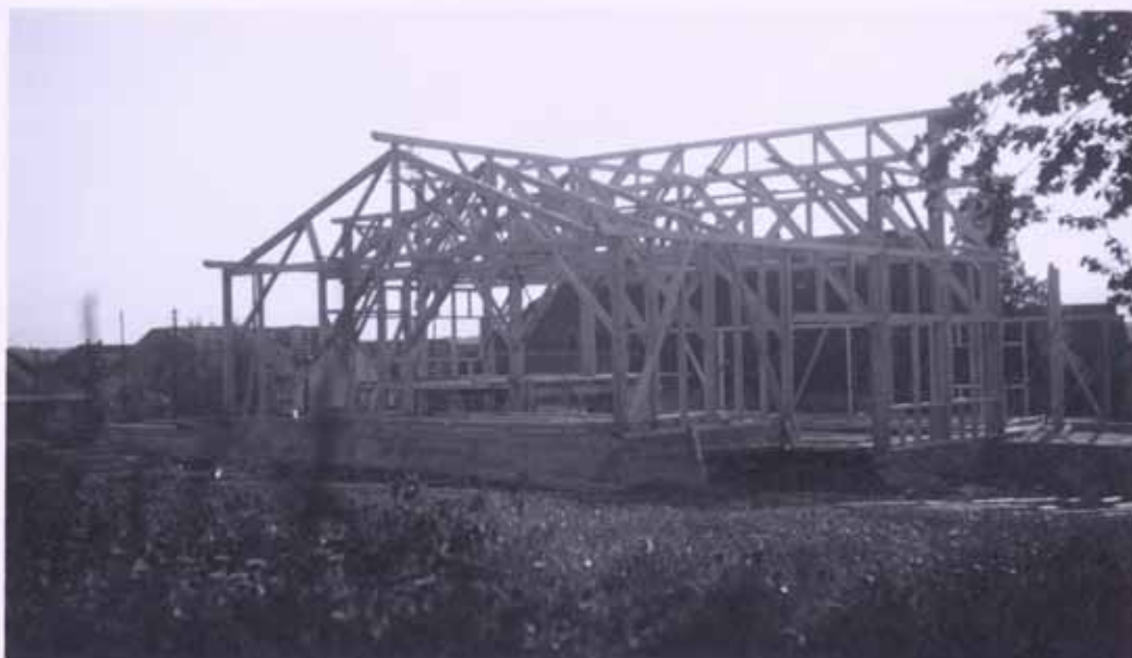
← Construction de la charpente avec au premier plan ce qui deviendra la scène.