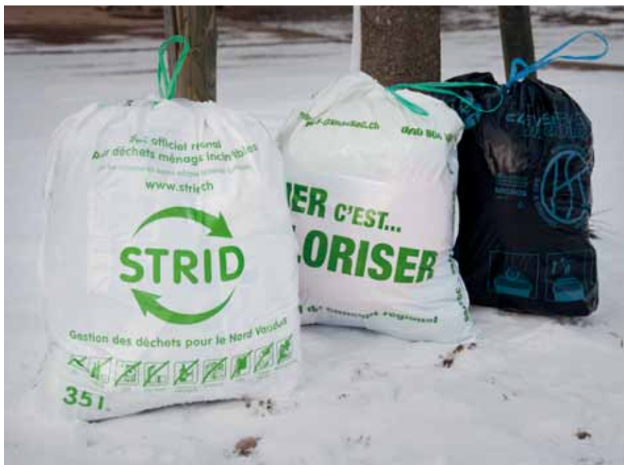
A gauche, les sacs officiels pour notre commune. Au milieu, les sacs officiels pour la région d'Echallens, à droite les sacs noirs traditionnels.