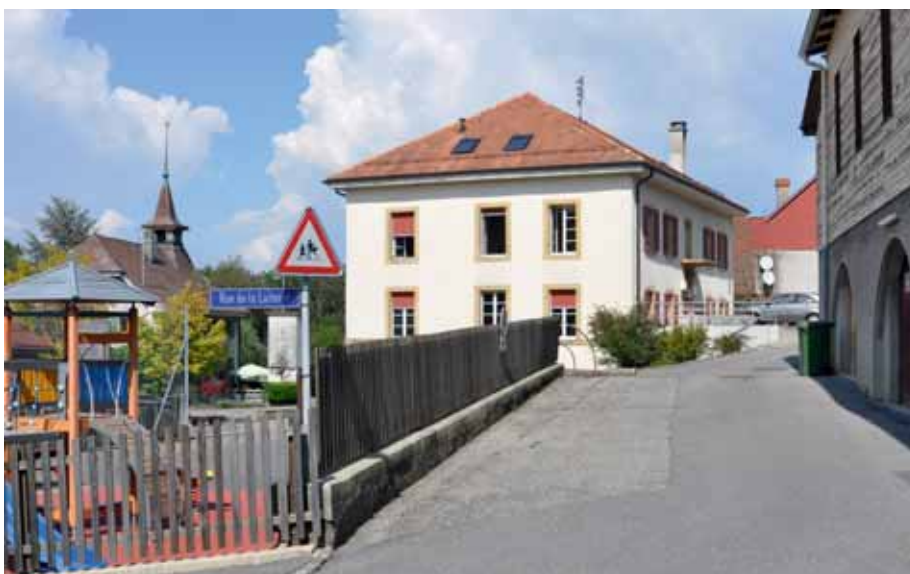
Le grand collège d'Essertines avec les deux cours de récréation

On remarque également la présence, sur la droite de l'image, d'un tilleul appartenant au restaurant de la Balance. Aujourd'hui la salle attenant au restaurant, commencée en 1939, puis arrêtée pendant la guerre et finalement terminée en 1941-1942, a remplacé l'arbre devenant trop imposant.