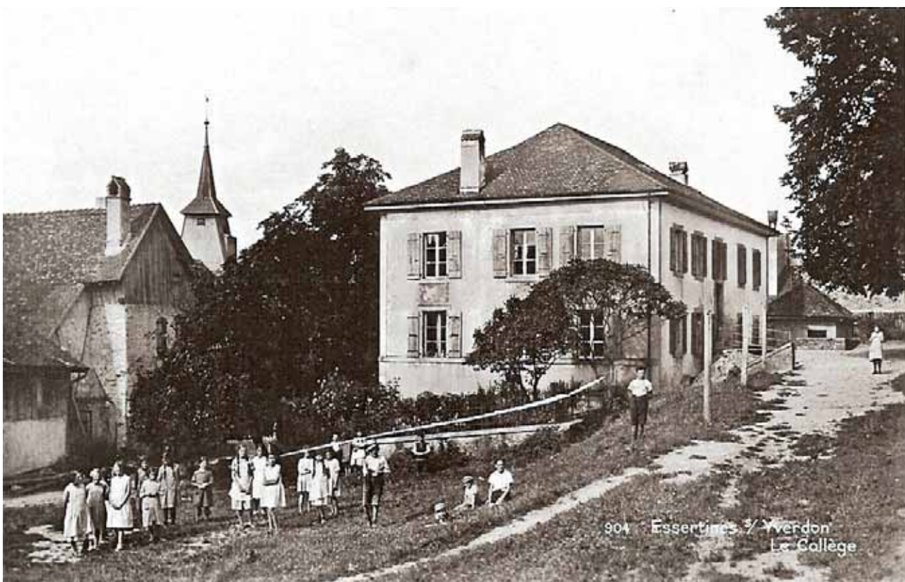
Photo de 1935 du grand collège (à droite) et de la Forge des Rochat (à gauche).