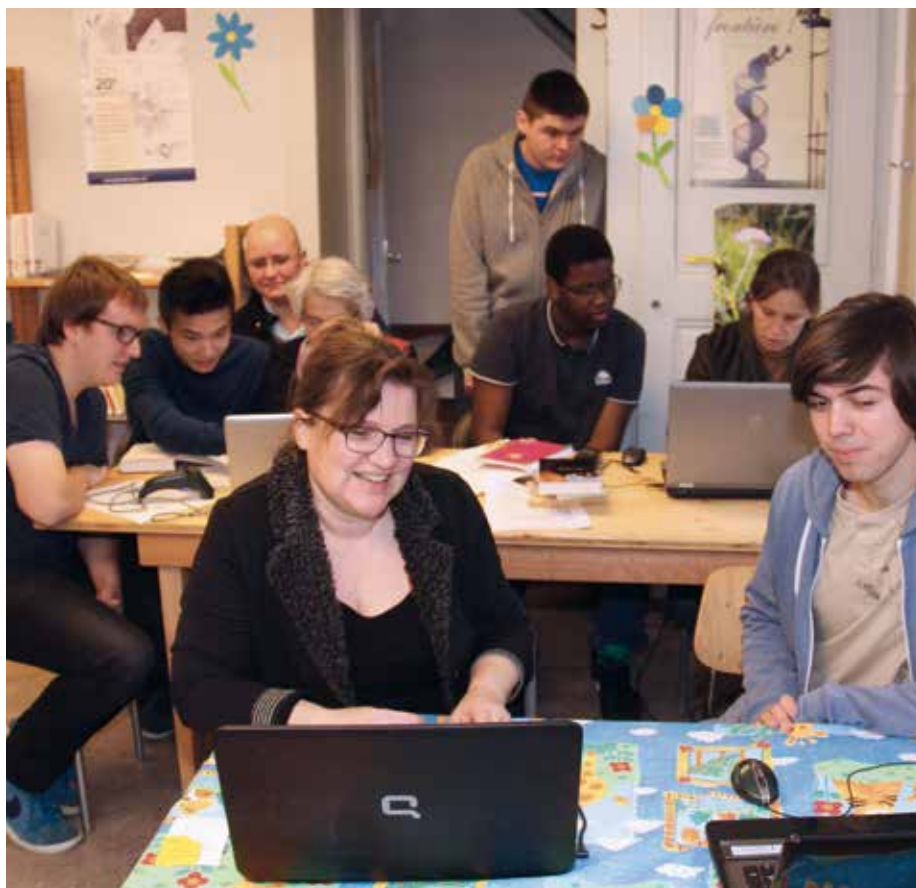
Une partie des bénévoles ainsi que les apprentis dans leur tâche d'informatisation.