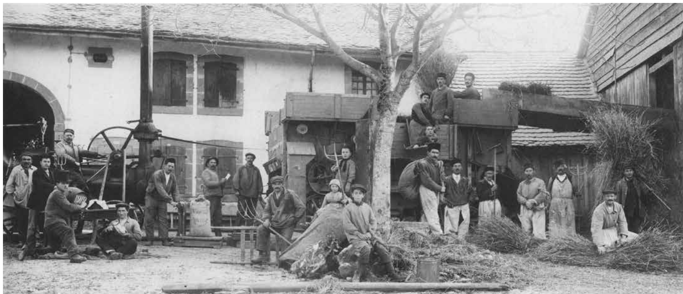
La batteuse mobile devant une ferme de Nonfoux. (Photo datant de décembre 1919)

Cette magnifique photo d'autrefois montre une batteuse telle qu'on en trouvait dans nos campagnes dans la première moitié du 20 e siècle.