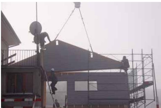
Les parois préfabriquées sont montées tel un lego géant avant de recevoir la charpente.