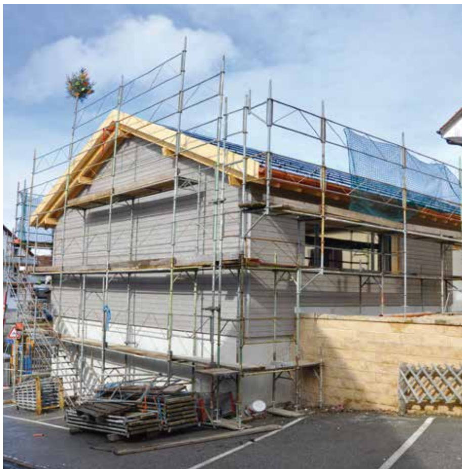
La rénovation de la Salle de la Balance en cours. Munie d'un toit équipé de panneaux photovoltaïques, elle répondra aux normes énérgétiques actuelles.