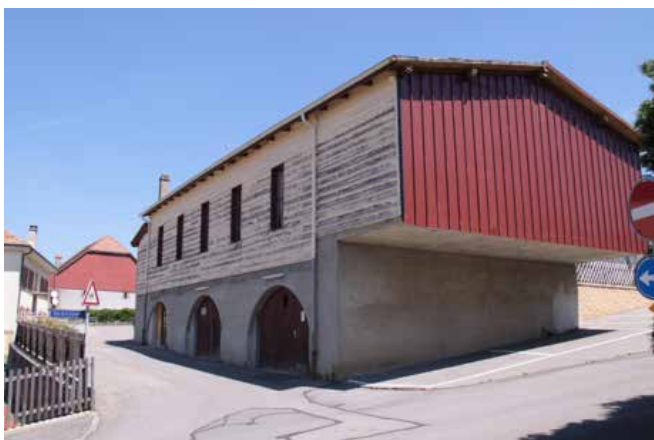
Datant de 1940-1941, l'ancienne salle, véritable « passoire thermique », avec sa partie sud en porte-à-faux qui n'existera plus dans la nouvelle salle.