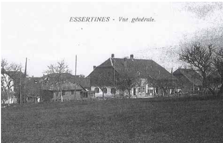
Photographie de l'Hôtel de la Balance en 1935 avec son pont de danse démoli en 1939 (petite construction en bois à gauche de la Balance). Ce pont de danse a été déplacé derrière la maison de Mme Lavanchy, quelques mètres plus loin.