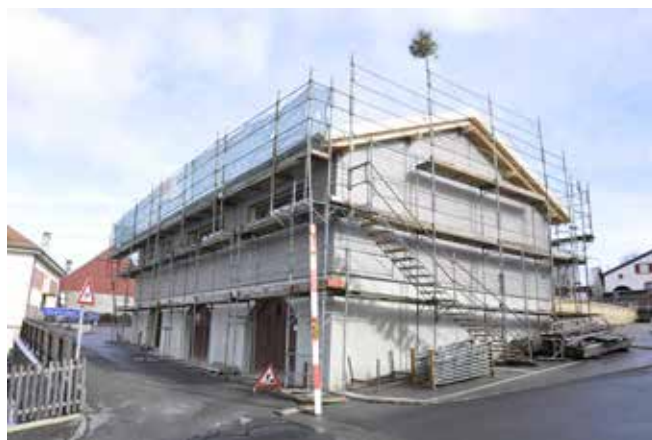
La salle en pleine rénovation (11 février 2016).