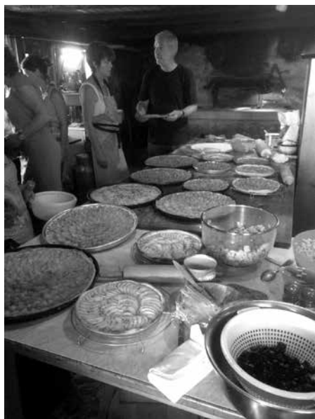
Les gâteaux prêts à être enfourner.

LE 1 er AOÛT AUX FOURNEAUX, TRAVAIL EN COULISSES.