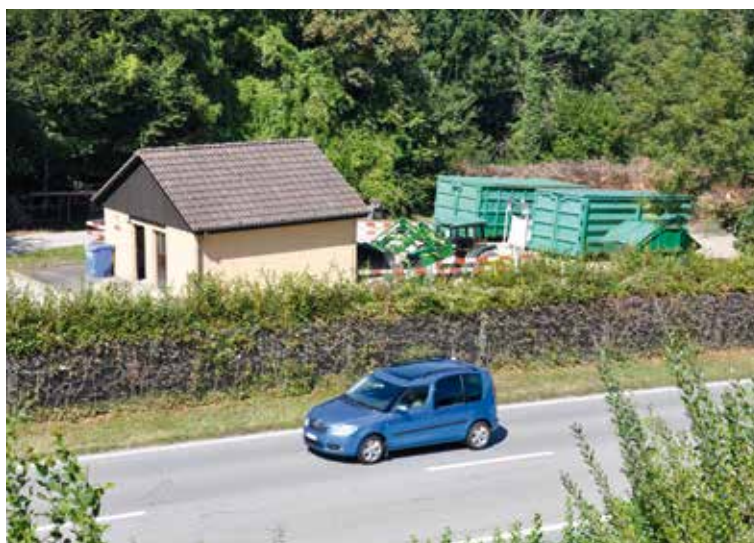
Le site aujourd'hui.

Les travaux ont commencé en octobre 2015. Il a fallu faire face à quelques difficultés lors des passages sous la route cantonale avec le procédé de forage horizontal dû à la présence de molasse. Les travaux de raccordement se sont terminés en juin 2016, et depuis cette date, les eaux usées d'Epautheyres sont acheminées gravitairement sur la STEP d'Yverdon. Quant à l'avenir du bâtiment de l'ancienne STEP, la Municipalité est en train d'y réfléchir.