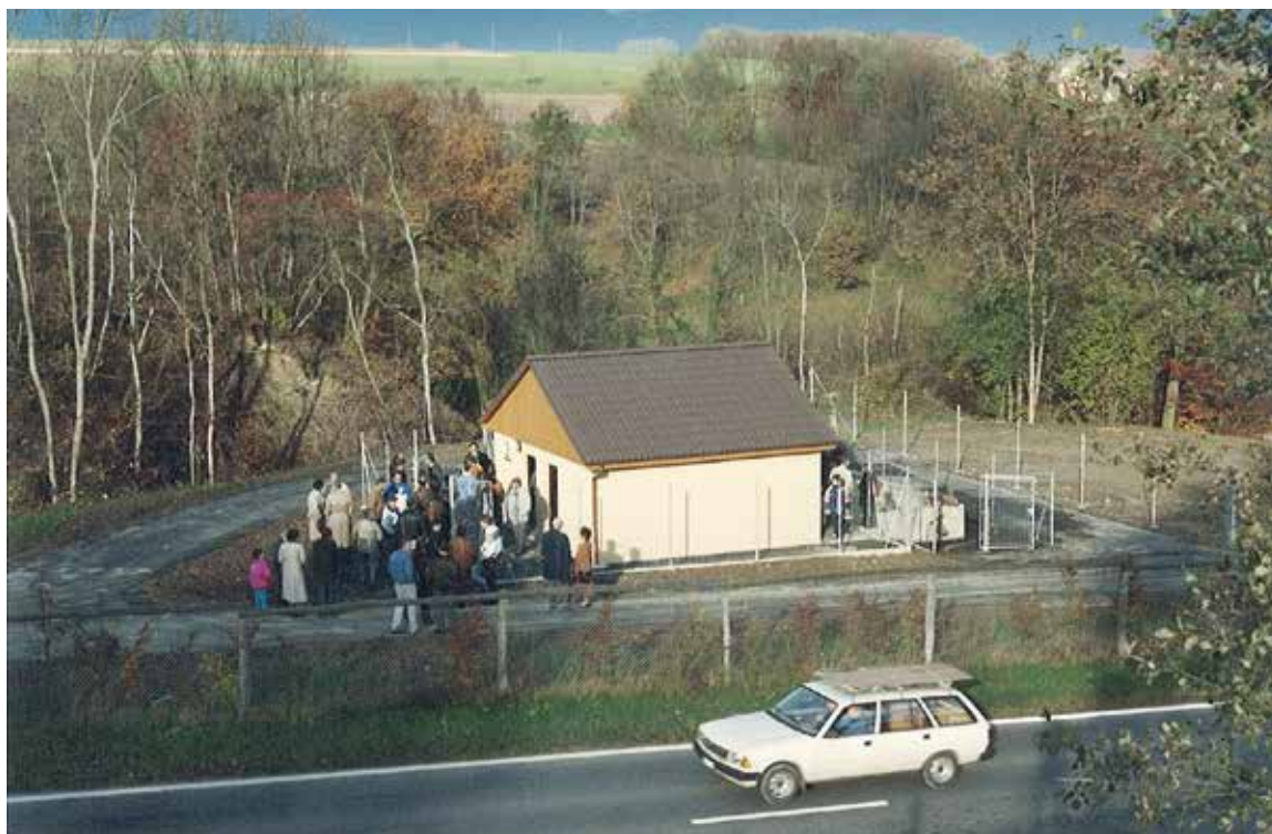
Photo prise en 1990, lors de l'inauguration.

En chantier dès le 20 mars 1990, la step a été mise en service le 6 novembre 1990. Construite sur le terrain de la décharge communale, en bordure de la RC 401, la step possède des dimensions contenues. Sa conception générale est «simple et rustique» pour l'époque. Aujourd'hui, dans le cadre de la nouvelle législation cantonale, de nouvelles normes trop exigeantes sont imposées.