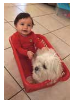
Giulia Tarchini, 9 mars